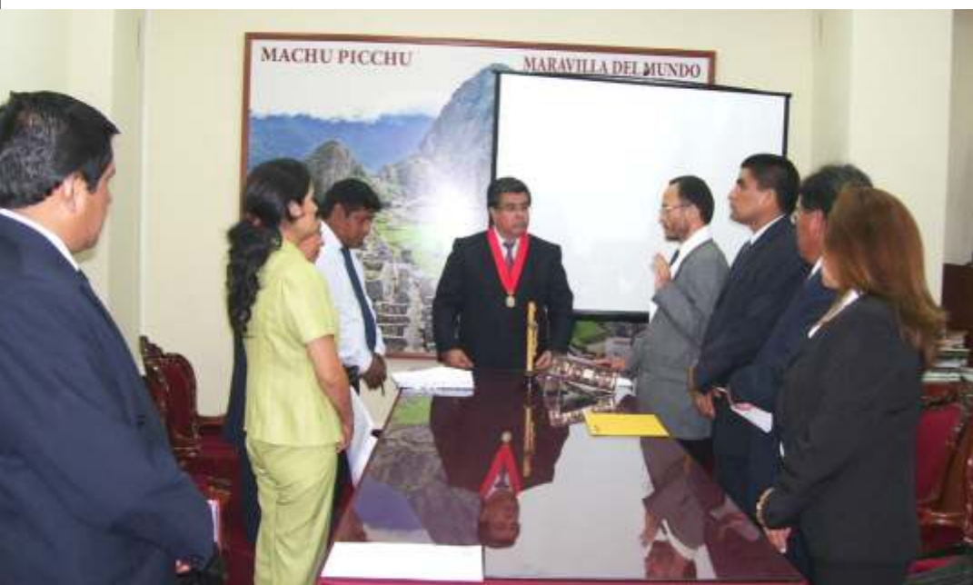
Al tomar juramento a los jueces, el doctor Rozas Escalante los exhortó a proceder con equidad, probidad y vocación de servicio a la comunidad.

La Corte Superior de Justicia de Lima Norte fue la primera en implementar y poner en funcionamiento los juzgados transitorios creados por el Consejo Ejecutivo del Poder Judicial (CEPJ) con el propósito de reducir la carga procesal en los órganos jurisdiccionales del país.