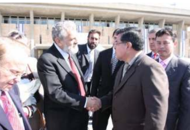
◀ Doctor Rozas Escalante intercambia saludos con el presidente del congreso israelí, Binyamin Elon.

"LOS MAGISTRADOS SON PIONEROS DE LA PAZ", AFIRMÓ DOCTOR ROZAS