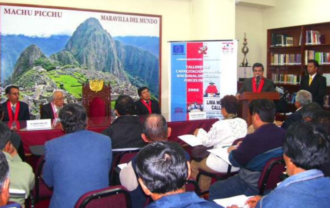
En la Corte de Lima Norte hay una permanente capacitación a los jueces de paz.

SE CONSTRUIRÁN EL CUARTO Y QUINTO PISO DEL EDIFICIO NUEVO