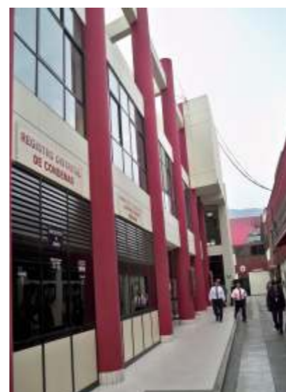
En las siguientes semanas se construirán el cuarto y quinto piso del edificio nuevo en un área de 2,227 metros cuadrados.

Artículo único: Modificar el artículo 70 de la Ley Orgánica del Poder Judicial. El nuevo texto será: "La justicia de paz es gratuita. Los gastos de las diligencias o actuaciones que se realicen fuera del despacho judicial correrán por cuenta de los interesados. Los jueces de paz perciben una dieta mensual de cien nuevos soles (s/.100.00). Para acceder a la dieta, el juez de paz deberá acreditar su titularidad con el acta de elección, resolución de nombramiento y acta de haber juramentado al cargo.