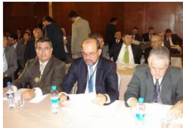
▶ Titular de la Corte de Lima Norte junto a los presidentes de las Cortes Supremas de Colombia y Paraguay.