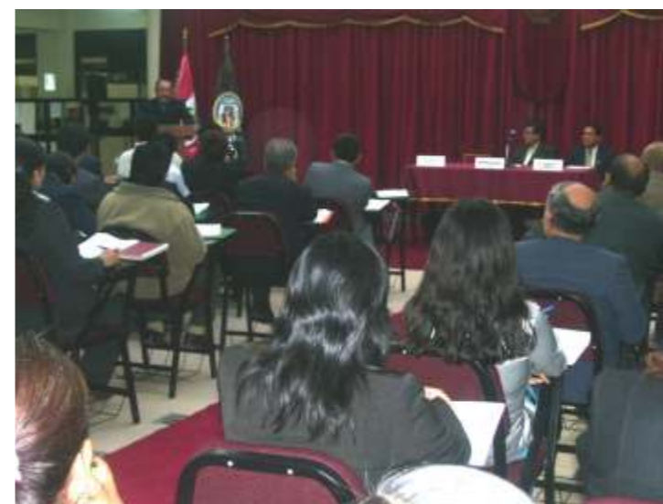
◀ Previo al día central, se realizaron jornadas académicas y recreativas.

A la ceremonia, asistieron distinguidas personalidades