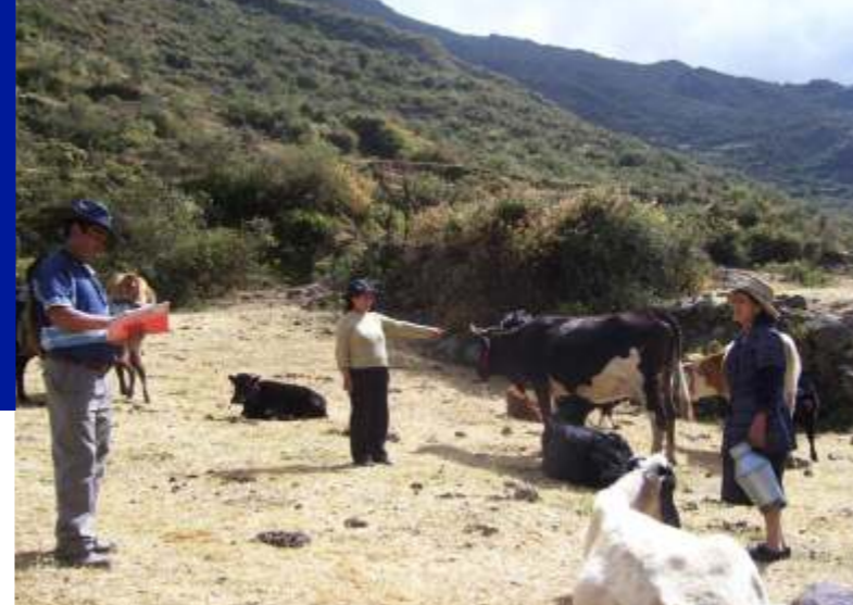
La controversia termino cuando la cría se acerco a amamantar a su verdadera madre. Las comuneras se estrecharon la mano en señal de conformidad.

por los seguidores de "Artemio". La camioneta en el que viajaban voló por los aires por efectos de la mina colocada en la carretera, hecho aprovechado por los maleantes para rematar a los ocupantes.