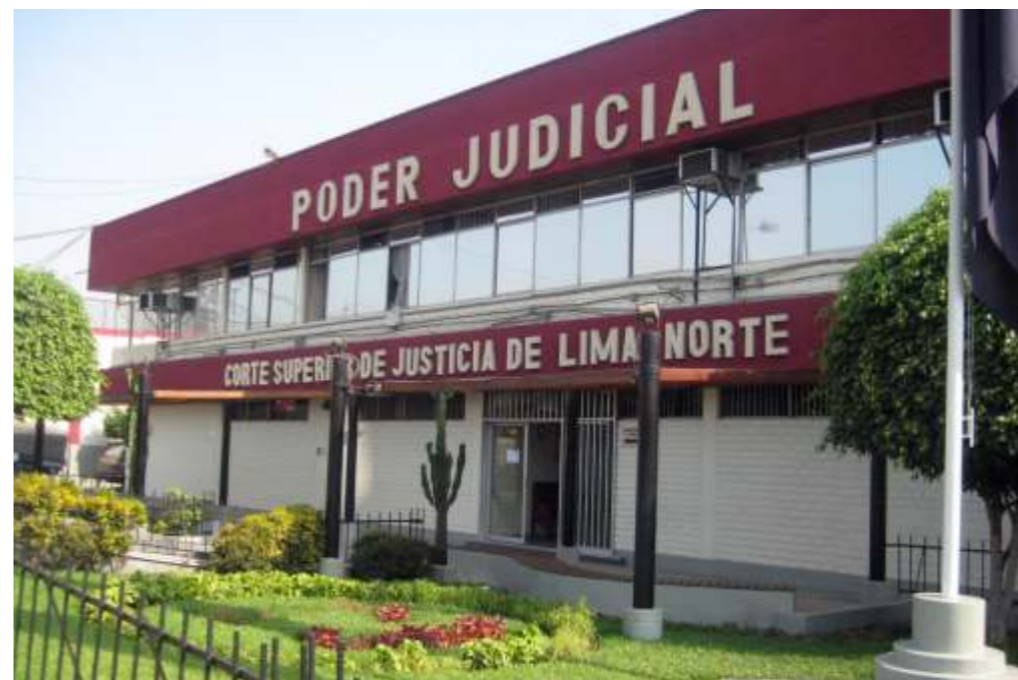
Las gestiones están avanzadas y en las siguientes semanas se iniciarán las obras de ampliación y mejora de la sede central de la Corte de Lima Norte.

construirá un moderno edificio de 4,178.27 metros cuadrados, distribuida en un sótano y tres pisos.