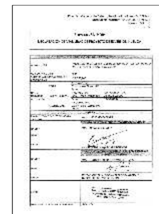
La Oficina de Programación e Inversiones del Poder Judicial aprobó y declaró la viabilidad del proyecto.