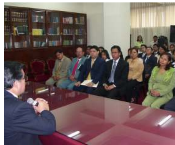
El personal paso por un proceso de selección.